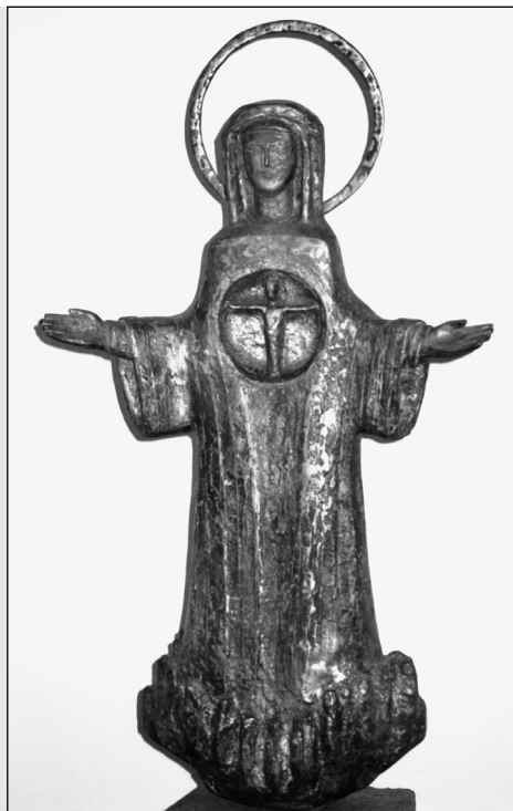
„Zeigmadonna“ von Christine Stadler steht in der Benediktinerinnenabtei Frauenwörth, Chiemsee